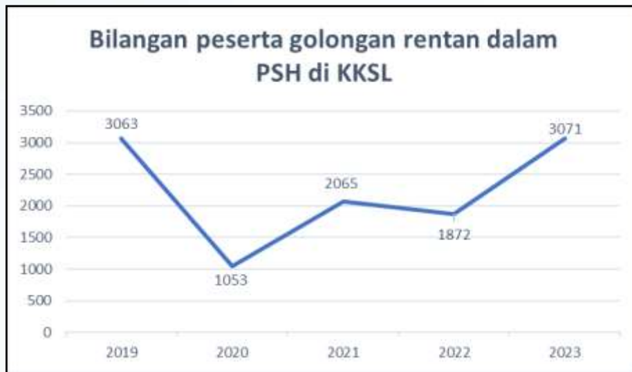
Rajah 1: Bilangan peserta PSH di Kolej Komuniti Selandar dalam tempoh 5 tahun (2019-2023)