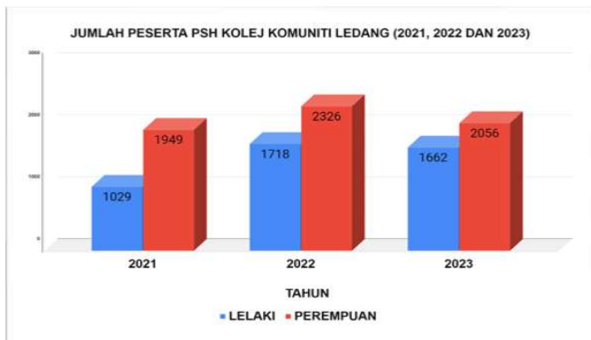
Rajah 1 : Perbandingan jumlah peserta lelaki dan perempuan

Rajah 1 di bawah menunjukkan data penyertaan adalah sebanyak 2978 orang peserta pada tahun 2021. Bilangan peserta lelaki seramai 1029 orang peserta (35%) dan peserta perempuan seramai 1949 orang peserta (65%). Namun, jumlah ini meningkat pada tahun 2022 seramai 4044 orang peserta, dengan bilangan peserta lelaki seramai 1718 orang peserta (42%) dan peserta perempuan seramai 2326 orang peserta (58%). Walau bagaimanapun, pada tahun 2023 dilihat trend penyertaan adalah menurun iaitu seramai 3718 orang peserta dengan bilangan peserta lelaki seramai 1662 orang peserta (45%) dan peserta perempuan seramai 2056 orang peserta (55%).